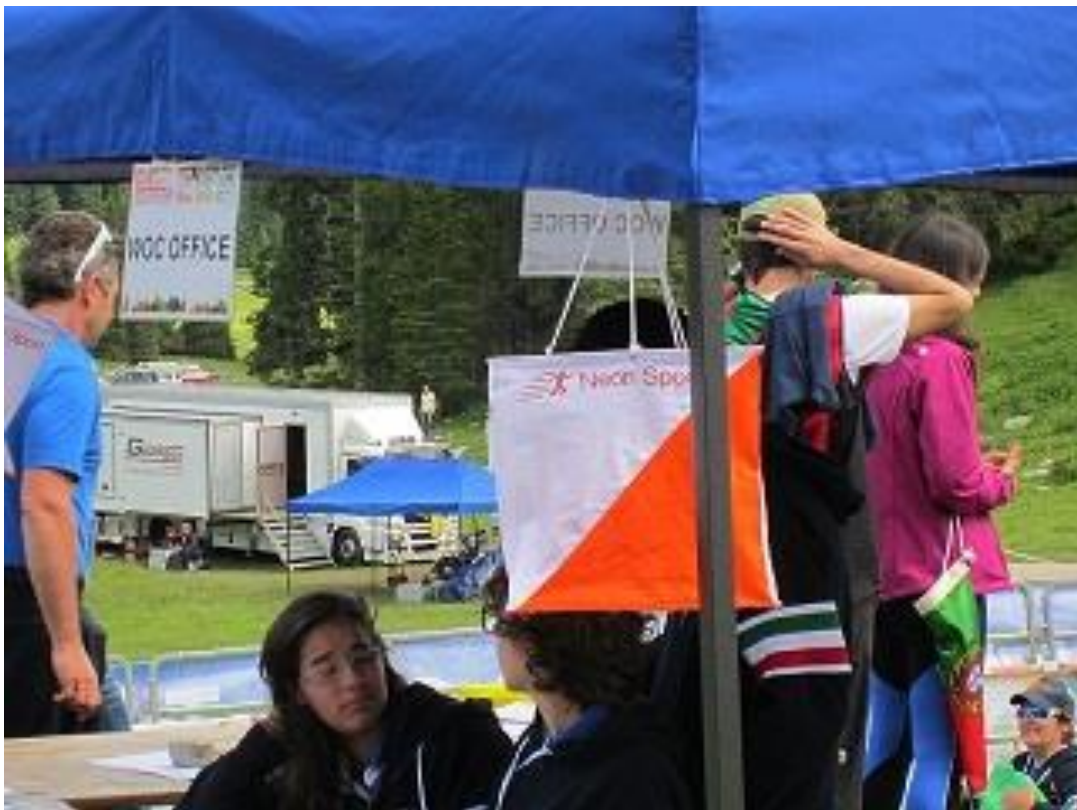
Italian MM-kisojen kisatoimistossa oli kovin tutun näköiset rastiliput