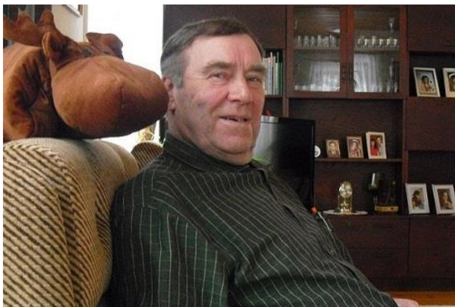
Mauri kotisohvalla Nuupalassa