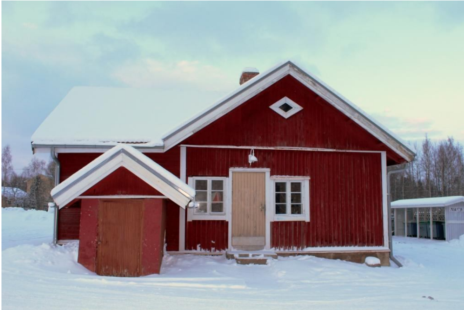
Kuva Teija Houttu

Suunta-Sepot on vuokrannut uudet kokous- ja varastotilat Kiikasta, osoitteesta Meijerinahde 1. Tiloissa on tilava varastuhuone, kokoushuone, keittiö ja WC. Vinkissä ei ole enää tiloja SuSen käytössä. Uosson varasto on toistaiseksi entisellään, tarkoitus on siirtää sieltäkin tavarat Kiikkaan.